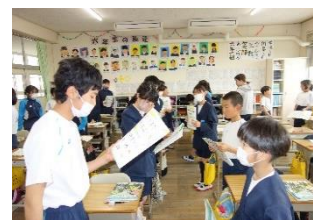
6年生 外国語科 Wellcome to Japan.