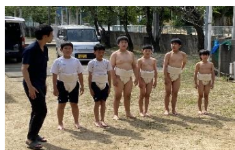
5年生 放課後練習 相撲部