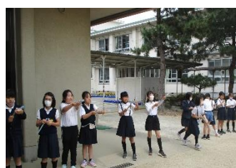
4年生 理科 空気でっぼう