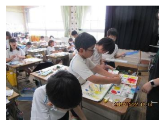
4年生 図工 絵の具でゆめもよう