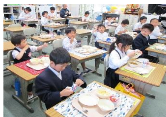
たんぽぽ学級 楽しい給食