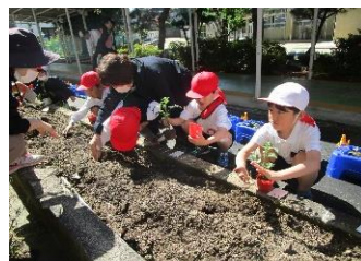
たんぽぽ学級 生活科 一人一野菜