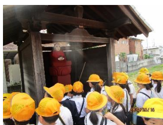
3年生 総合 校区探検