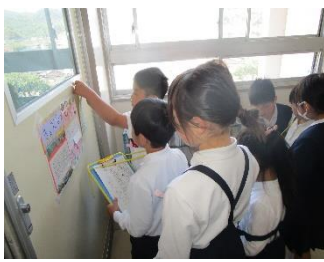
2年生 生活科 1年生を案内したよ