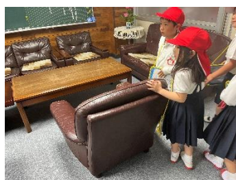
1年生 生活科 1年生だけの学校探検