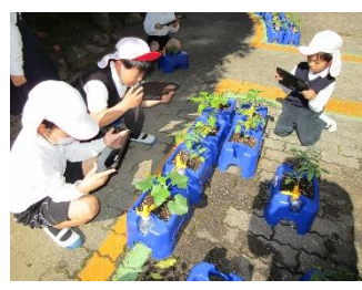
2年生 生活科 野菜を育てよう