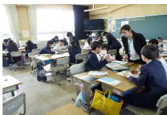
5年生 算数科 体積