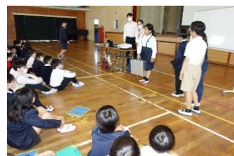
6年生 総合 租税教室