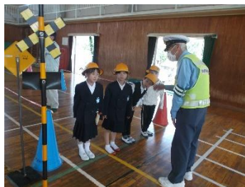
1年生 交通安全教室 歩き方教室